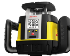
Rotations- & Neigungslaser