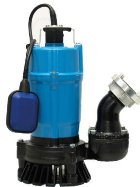
Pumpen-Prüfung nach DGUV 3