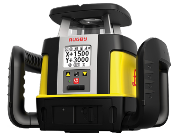
Rotations- & Neigungslaser